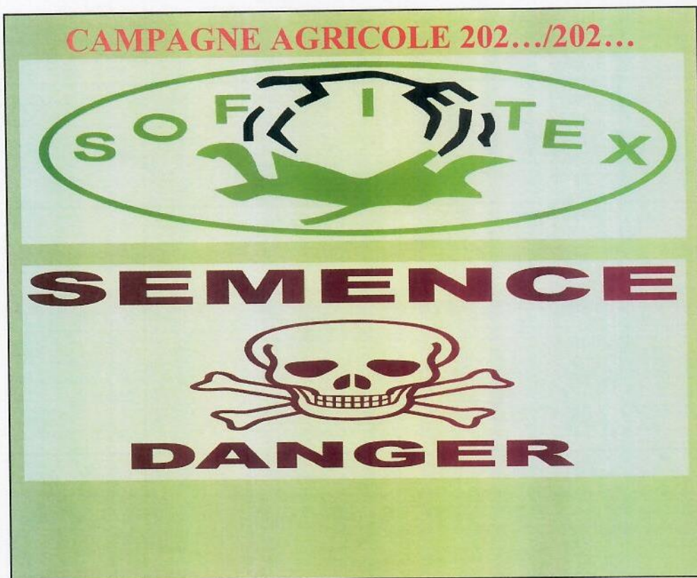
Face A du sac 60 cm x 60 cm présentant les logos